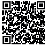
Invasive Diagnostik und Therapie